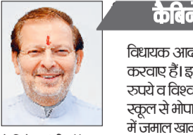
कैबिनेट मंत्री डॉ. अरविंद शर्मा।

राज्य सरकार गोहाना विधानसभा में 188 लाख रुपये खर्च किए जाएंगे। इस राशि से क्षेत्र में गली, चौपाल और शमशान घाट के शेड के निर्माण सहित अन्य विकास कार्य पूरे किए जाएंगे। कैबिनेट मंत्री डॉ. अरविंद शर्मा ने कहा कि राज्य सरकार द्वारा नए साल में गोहाना विधानसभा में विकास कार्यों के लिए निरंतर धनराशि मंजूर की जा रही है। सरकार द्वारा गोहाना