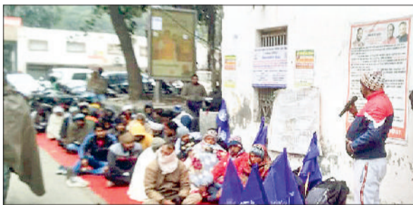
सोनीपत। विरोध प्रदर्शन करते हुए ठेका सफाई कर्मचारियों।