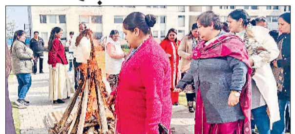
राई। लोहड़ी पर्व शिक्षकों द्वारा बड़े ही हर्षोल्लास और पारंपरिक उत्साह से मनाते हुए।

राई। जीडी गोयनका इंटरनेशनल स्कूल, सोनीपत में लोहड़ी पर्व शिक्षकों द्वारा बड़े ही हर्षोल्लास और पारंपरिक उत्साह के साथ मनाया गया। विद्यालय परिसर में सौहार्द एवं उत्साहपूर्ण वातावरण देखने को मिला। कार्यक्रम का शुभारंभ पारंपरिक रूप से अग्नि प्रज्वलन के साथ किया गया, जिसमें शिक्षकों ने तिल, मूंगफली, रेवड़ी एवं पॉपकॉर्न अर्पित कर सुख-समृद्धि की कामना की। शिक्षकों ने लोहड़ी पर्व के सांस्कृतिक एवं सामाजिक महत्व