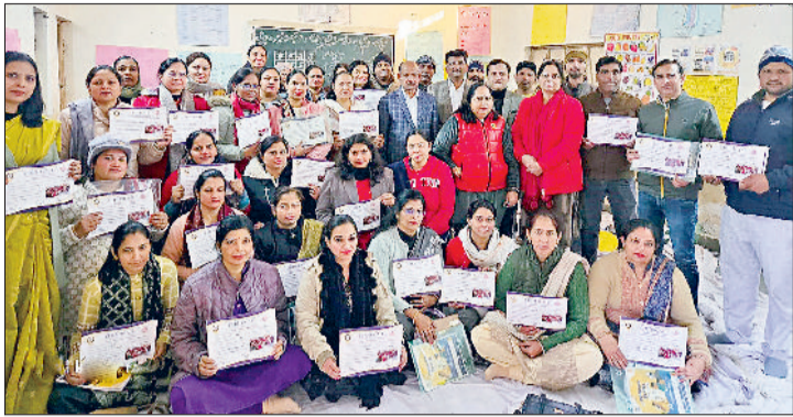
सोनीपत। सोनीपत के गद्दी ब्राह्मण स्थित राजकीय विद्यालय में कार्यशाला के समापन पर खंड शिक्षा अधिकारी के साथ मौजूद प्रतिभागी शिक्षक।