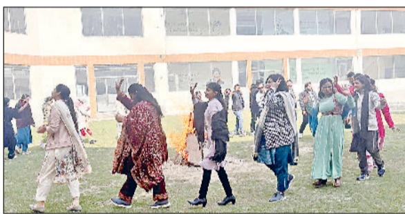
गन्नीौर। बाल भवन इंटरनेशनल स्कूल में लोहड़ी का पर्व मनाते हुए।

बाल भवन इंटरनेशनल स्कूल, गन्नीौर में लोहड़ी का पर्व पूरे हर्षोल्लास और पारंपरिक उत्साह के साथ मनाया। विद्यालय के शिक्षकों ने सामूहिक रूप से लोहड़ी पर्व का आयोजन कर भारतीय संस्कृति और परंपराओं को जीवंत रूप में प्रस्तुत किया। कार्यक्रम की शुरुआत पारंपरिक विधि से पवित्र अग्नि प्रज्वलित कर की गई। इसके बाद शिक्षकों ने अग्नि के चारों ओर एकत्र होकर एक-दूसरे को पर्व की शुभकामनाएं दीं। मूंगफली, रेवड़ी, गजक अर्पित कर लोहड़ी की परंपराओं का निर्वहन किया गया।