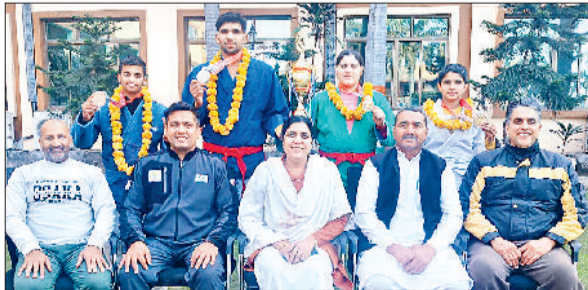
सोनीपत। इंडियन मॉडर्न वरिष्ठ माध्यमिक विद्यालय प्रबंधन व प्रशिक्षक के साथ मौजूद पदक विजेता खिलाड़ी।