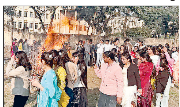
सोनीपत। साउथ प्वाइंट कॉलेज ऑफ नर्सिंग में आयोजित लोहड़ी उत्सव पर अग्नि की परिक्रमा कर मूंगफली व रेवड़ी का प्रसाद अर्पित करती छात्राएं।

साउथ प्वाइंट कॉलेज ऑफ नर्सिंग में लोहड़ी पर्व उत्साह, उमंग व पारंपरिक परंपराओं संग लोकगीतों के साथ मनाया गया। लोहड़ी प्रज्वलित करने के बाद चारों ओर छात्र-छात्राओं व स्टाफ सदस्यों ने परिक्रमा कर मूंगफली, रेवड़ी, तिल व पॉपकॉर्न का प्रसाद अर्पित कर सुख-समृद्धि की कामना की। विद्यार्थियों ने पारंपरिक पंजाबी गीतों पर नृत्य किया, बोलियां बोलीं, लोकनृत्य से माहौल को जीवंत बनाया। ढोल की थाप व तालियों की गूंज के बीच महाविद्यालय परिसर उत्सवमय नजर आया। विद्यार्थियों ने सुंदर मुंदरिये हो, तेरा कौन विचारा